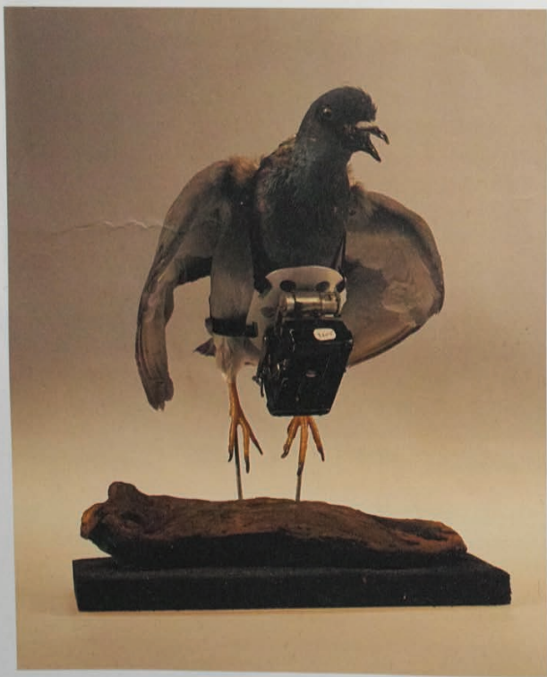
ドッセル・シュボルト/ユリウス・ノイブロンナー/1908年頃